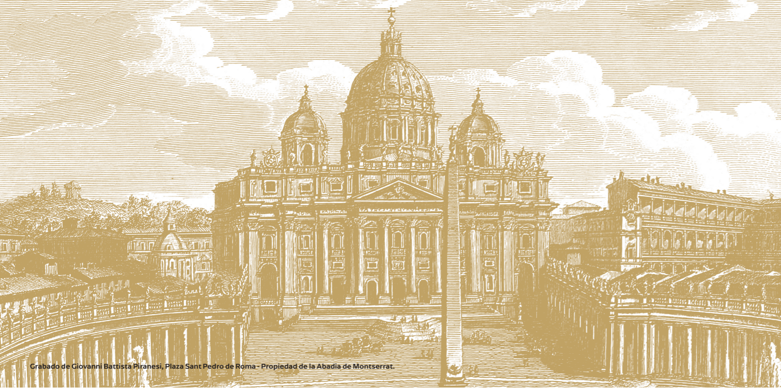
Grabado de Giovanni Battista Piranesi, Plaza San Pedro de Roma - Propiedad de la Abadía de Montserrat.